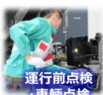
運行前点検 ・車両点検