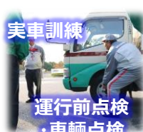
運行前点検 ・車両点検