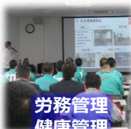
労務管理 健康管理