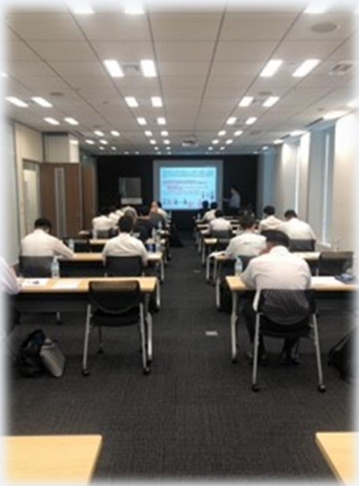
実際の授業の様子

本コースでは、運行管理者試験の試験科目①貨物自動車運送事業法関係、②道路運送車両法関係、③道路交通法関係、④労働基準法関係、⑤その他必要な実務上の知識及び能力等、2日間の緊張感ある講義で合格を目指します。